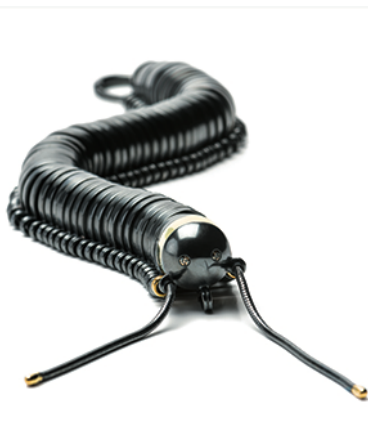
Fie Bodenhoffs tusindben